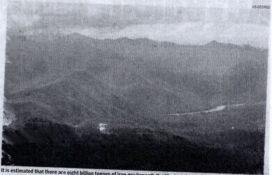
It is estimated that there are eight billion tonnes of iron ore beneath the Western Ghats

"Mining is necessary for the progress of the country and eight billion tonnes of ore deposit certainly make everybody look at Western Ghats. We do not have to just go by the propaganda campaign of the conservationists. We are also concerned about forest and conservation. Underground mining is a little expensive, but keeping in mind the biodiversity of the Western Ghats, it can be taken up."